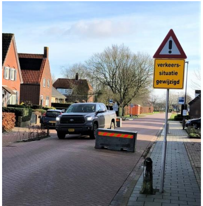
Betonblokken worden vervangen door bloembakken bij aanvullende werkzaamheden aan de Vrachelsestraat.

De tijdelijke betonblokken worden vervangen door chicanes in de vorm van bloembakken. Ook twee versmallingen worden voorzien van bloembakken. Eén versmalling wordt vervangen door een 30 km/uur-drempel. De chicanes kunnen buitenom gepasseerd worden door fietsers en voetgangers. Ook krijgen ze een attentie verhogende markering. Automobilisten worden extra geattendeerd op de maximum snelheid van 30 km/uur. Aan te planten hagen moeten een visueel remmend effect bewerkstelligen. Een tekening van de aanpassingen is te zien op de gemeentelijke website.