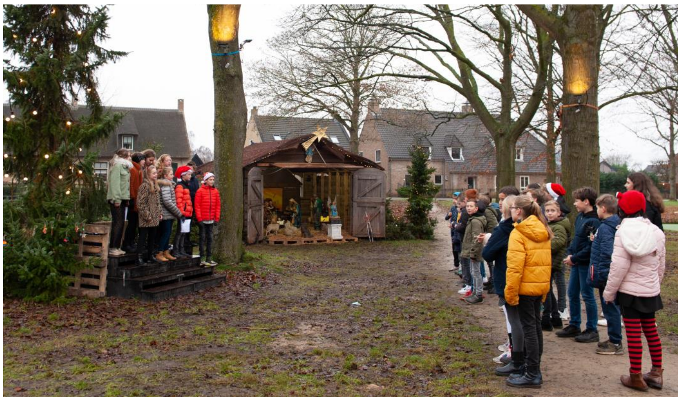
Het kerstkoor van Brede Dorpsschool De Achthoek zingt voor de andere kinderen van de school tijdens de vervroegde kerstviering op 17 december. De viering moest vervroegd worden vanwege de verplichte kerstvakantie vanaf maandag 20 december. Oorzaak: corona!