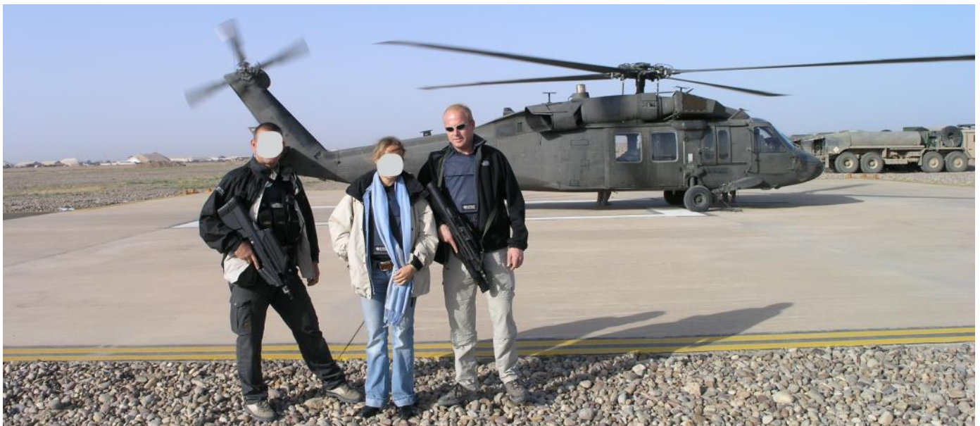
Irak 2005: Aart met collega en iemand van de ambassade onderweg van Bagdad naar Erbil in een Black Hawk helikopter.

maanden. Door inzet van onze foundation had de persoon in kwestie binnen een week een aangepaste auto! Toen alles rond was met defensie en hij een auto kon aanschaffen, kwam 'onze' auto weer terug."